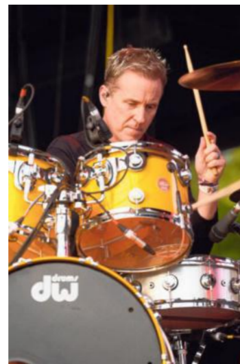
Josh Freese in 2021.

De in 1972 in Orlando, Florida geboren Freese begon op zijn twaalfde in Disneyland, waar hij in een band speelde. Zijn vader, tubaspeler, runde de muzikafdeling van het park. Op zijn zestiende ging hij van school om te touren met Dweezil Zappa (zoon van) en in 1989 met punkband The Vandals. Daarnaast werd Freese