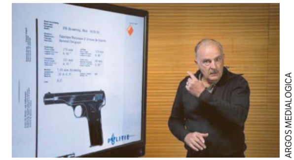
Wapenexpert buigt zich over 'Arnhemse villamoord'.