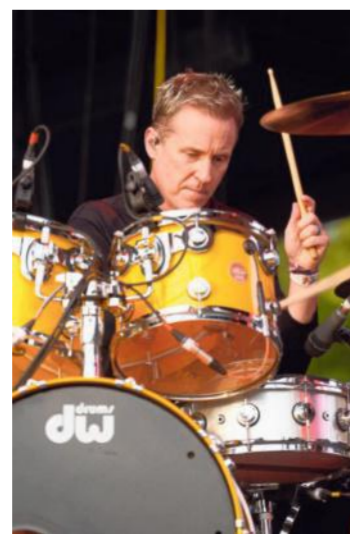
Josh Freese in 2021.

De in 1972 in Orlando, Florida geboren Freese begon op zijn twaalfde in Disneyland, waar hij in een band speelde. Zijn vader, tubaspeler, runde de muzikafdeling van het park. Op zijn zestiende ging hij van school om te touren met Dweezil Zappa (zoon van) en in 1989 met punkband The Vandals. Daarnaast werd Freese